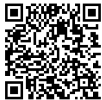
全国統一小学生テスト 申込ページ二次元コード

■会場 周辺地図・住所 ■ ※送迎の際の路上駐車および近隣施設への駐車はご遠慮下さい。ご理解ご協力を宜しくお願い致します。